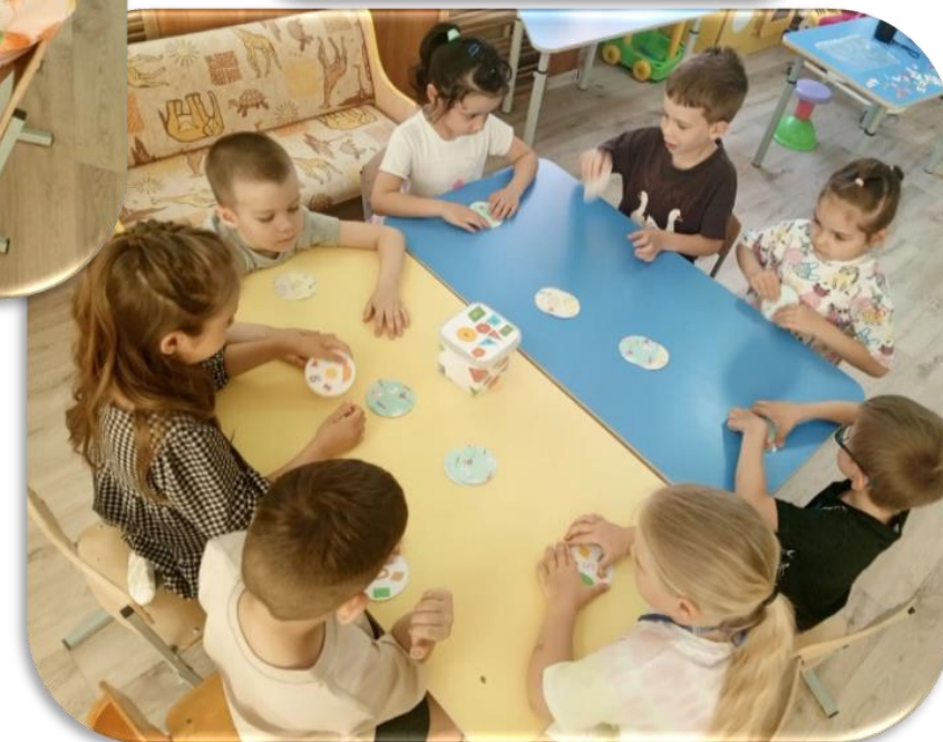
Дружно играем в группе