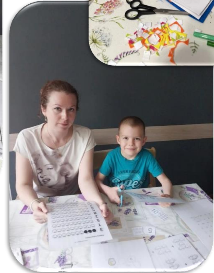
Изготовление дидактических игр по ФЭМП