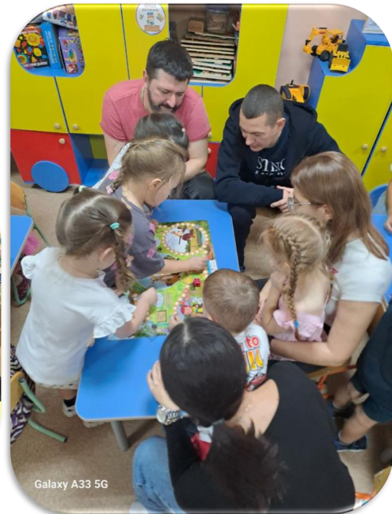
«Семейная математика: игры, которые сближают»