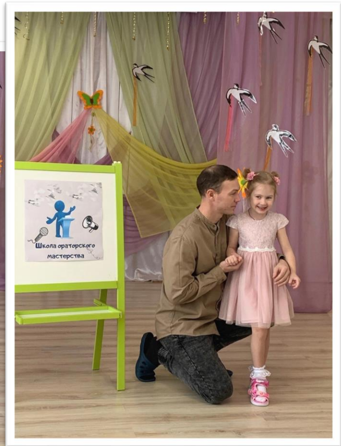
Конкурсы чтецов на уровне детского сада