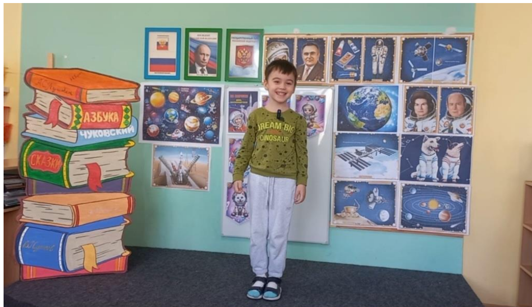
Конкурсы чтецов в группе