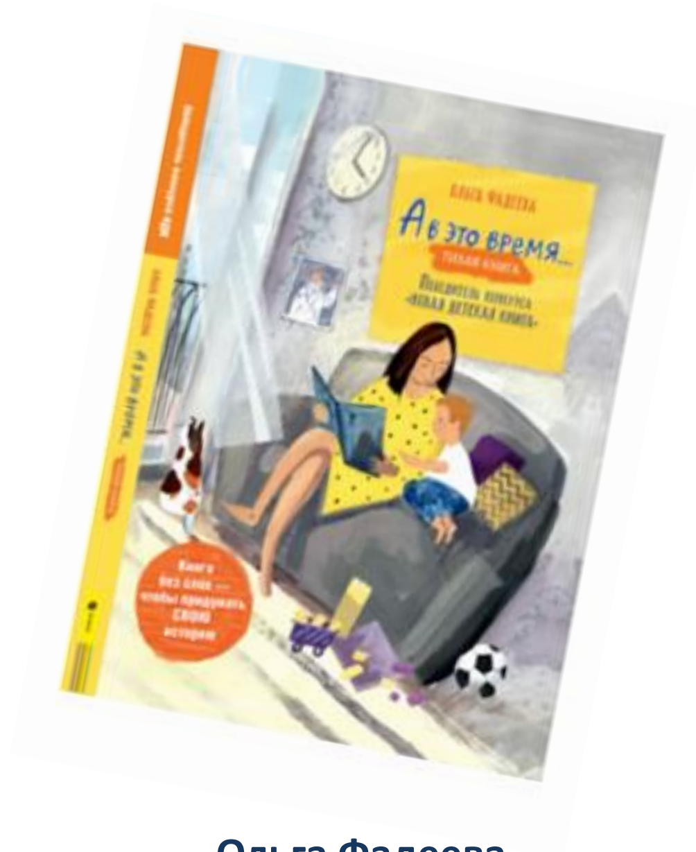
Ольга Фадеева, иллюстрации автора, М.: РОСМЭН, 2022