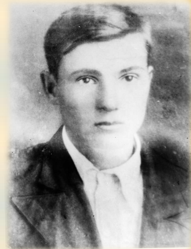
Герой Советского Союза А.Д. Вологин.